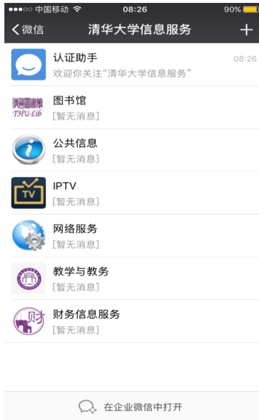
图 9 绑定成功