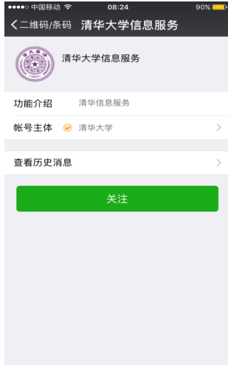
图 4 关注“清华大学信息服务”