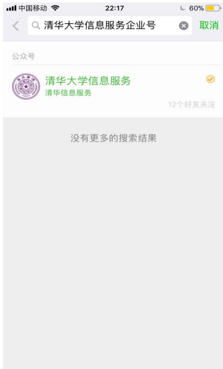
图 3 搜索“清华大学信息服务企业号”