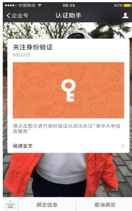
图 6 点击后出现“关注身份验证”页面