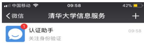
图 5 点击“认证助手”